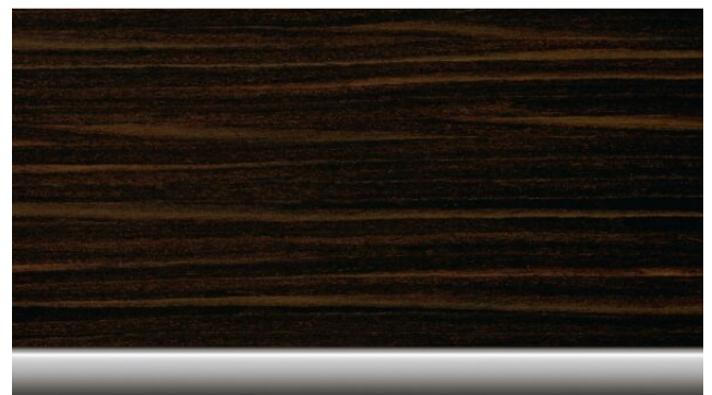
Edelholzausführung 0,00 € 'Fineline Stripe' braun 4KR