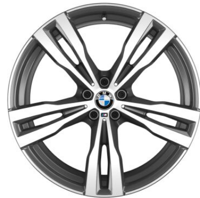
21" M LMR Doppelspeiche 0,00 € 754 M Bicolor / NLE 1PB