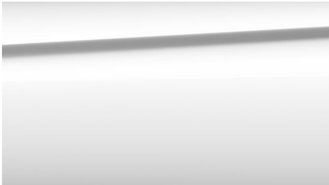
Alpinweiß uni 300