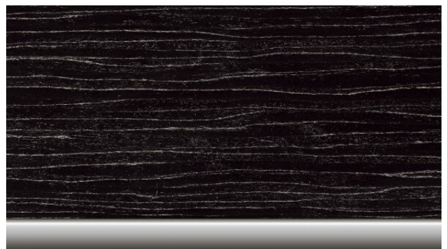
Edelholzausführung 200,00 € "Fineline" schwarz mit 4LM