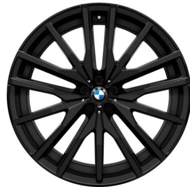
22" M LMR 1.910,00 € Doppelspeiche 742 M / 1PQ