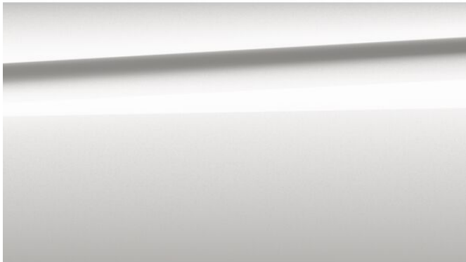
Mineralweiß metallic 1.070,00 € A96